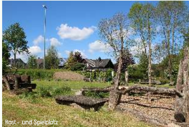
Rast- und Spielplatz

Die erste Kirche entstand vermutlich bereits im 12. Jahrhundert. Urkundlich wird die Kirche erstmals im Jahr 1510 erwähnt. Weil das Kirchenschiff Mitte des 19. Jahrhunderts baufällig wurde, entstand 1866 ein Neubau. Das alte Kirchenschiff wurde abgerissen und ein größeres im neugotischen Stil errichtet. Der alte Kirchturm blieb erhalten und bekam eine Verkleidung mit Bruchsteinen.