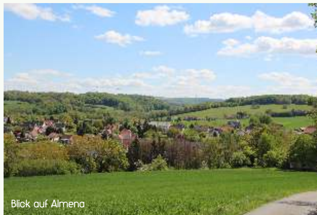
Blick auf Almena